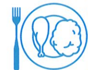
Je mange en quantité suffisante