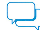
Je donne et je prends des nouvelles de mes proches