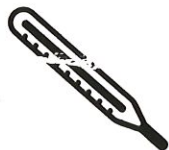
Fièvre > 38°C