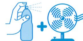
Je mouille mon corps et je me ventile