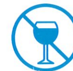
Je ne bois pas d'alcool