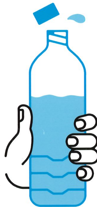
JE BOIS RÉGULIÈREMENT DE L'EAU