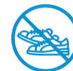
J'évite les efforts physiques